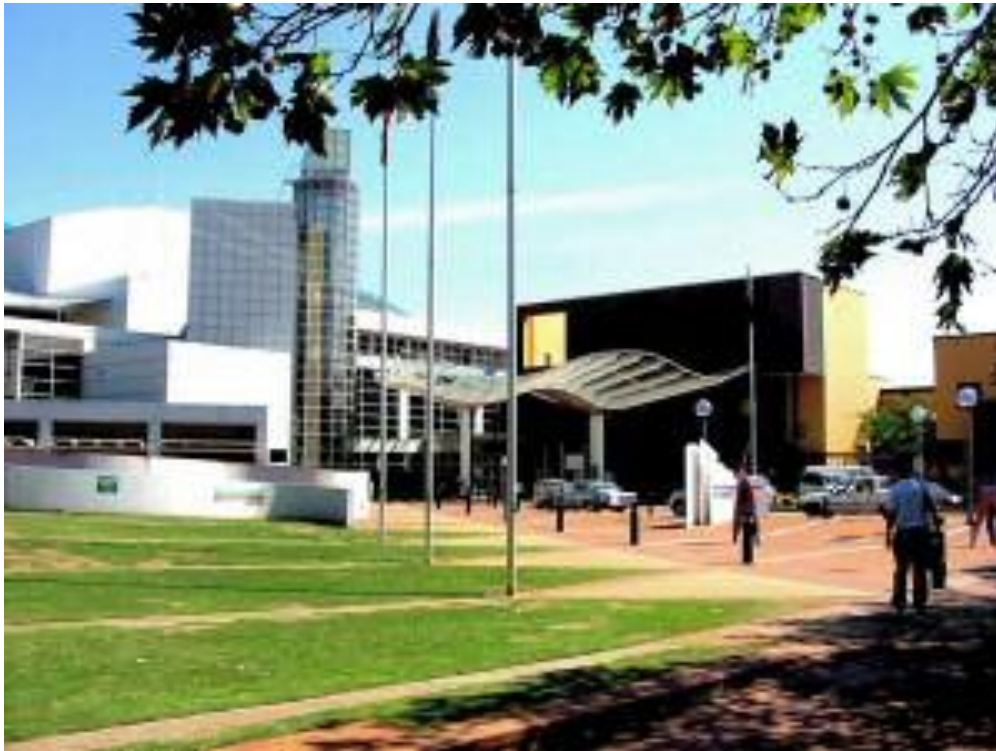
Ryc. 36. Szpital kliniczny w Weastmead, Australia.

nowatorskie i skuteczne, iż celem jest przedstawienie tego właśnie aspektu opieki farmaceutycznej w niniejszej pracy. Na rycinie 36 przedstawiono szpital kliniczny w australijskim Weastmead, w którym szkolenie farmaceutów klinicznych stoi na szczególnie wysokim poziomie.